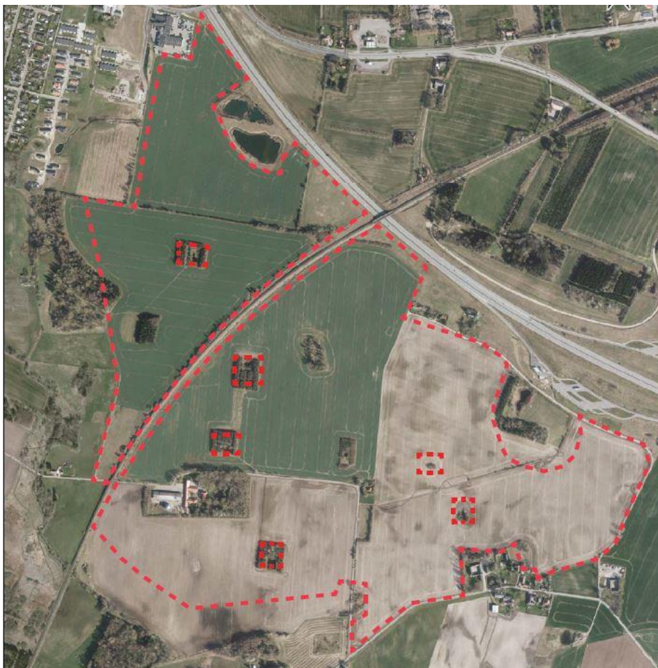
Lokalplanområdet i dag, inkl. lokalplanafgrænsning